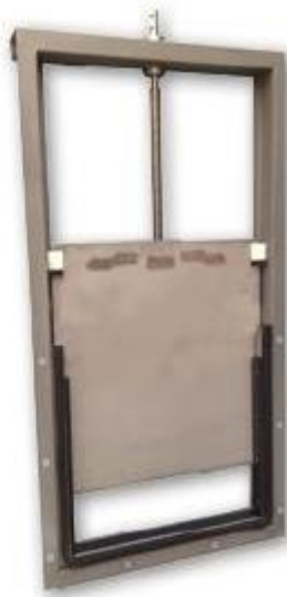
Vedere din spate