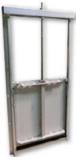
Vedere din față

Garniturile pretensionate oferă o etanșeitate remarcabilă în ambele poziții - (din față și din spate) a stăvilărilor.